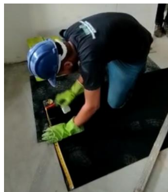
Imagem 2 Foto ilustrativa da marcação da medida do ambiente na manta Aubicon com o giz de cera

Para fazer a marcação do corte utilizar giz de cera;