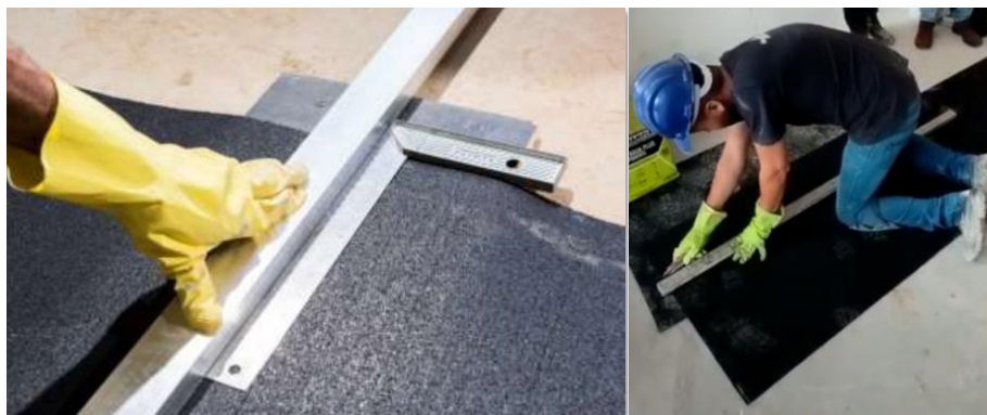
Imagens 3 e 4 Foto ilustrativa do corte da manta Aubicon com estilete

O corte do material deve ser feito com estilete apoiando a régua metálica sobre um pedaço de madeira (madeirit) utilizando um esquadro para que o corte fique em ângulo de 90 graus, conforme imagens abaixo;