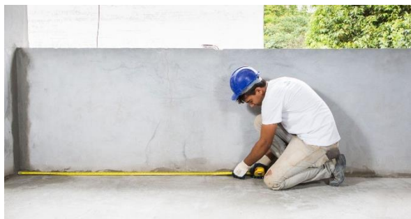
Imagem 1 Foto ilustrativa da medição do ambiente

O ambiente deve ser medido previamente para corte e melhor aproveitamento das mantas;