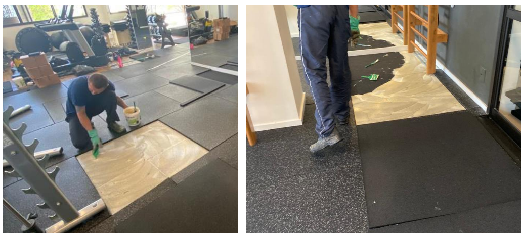
Imagens 9 e 10

Com uma desempenadeira dentada metálica de 3 mm, aplique uma camada do adesivo pu bicomponente em uma pequena área sobre a base de aproximadamente 2 a 3mm, conforme imagens abaixo;