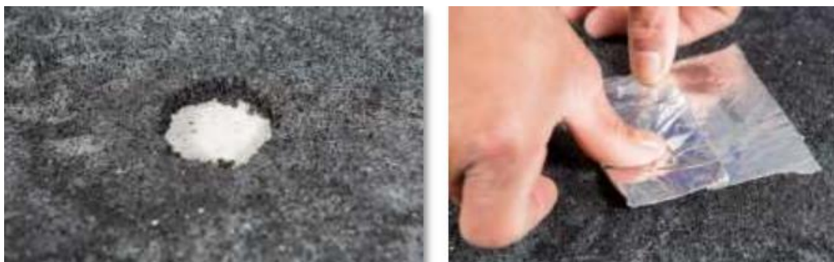
Imagens 12 e 13

Caso ocorra furo na Manta Borracha E-Layer deve ser preenchido com um pedaço do mesmo material e proteja o local com uma fita adesiva forte e durável (tipo Silver Tape);